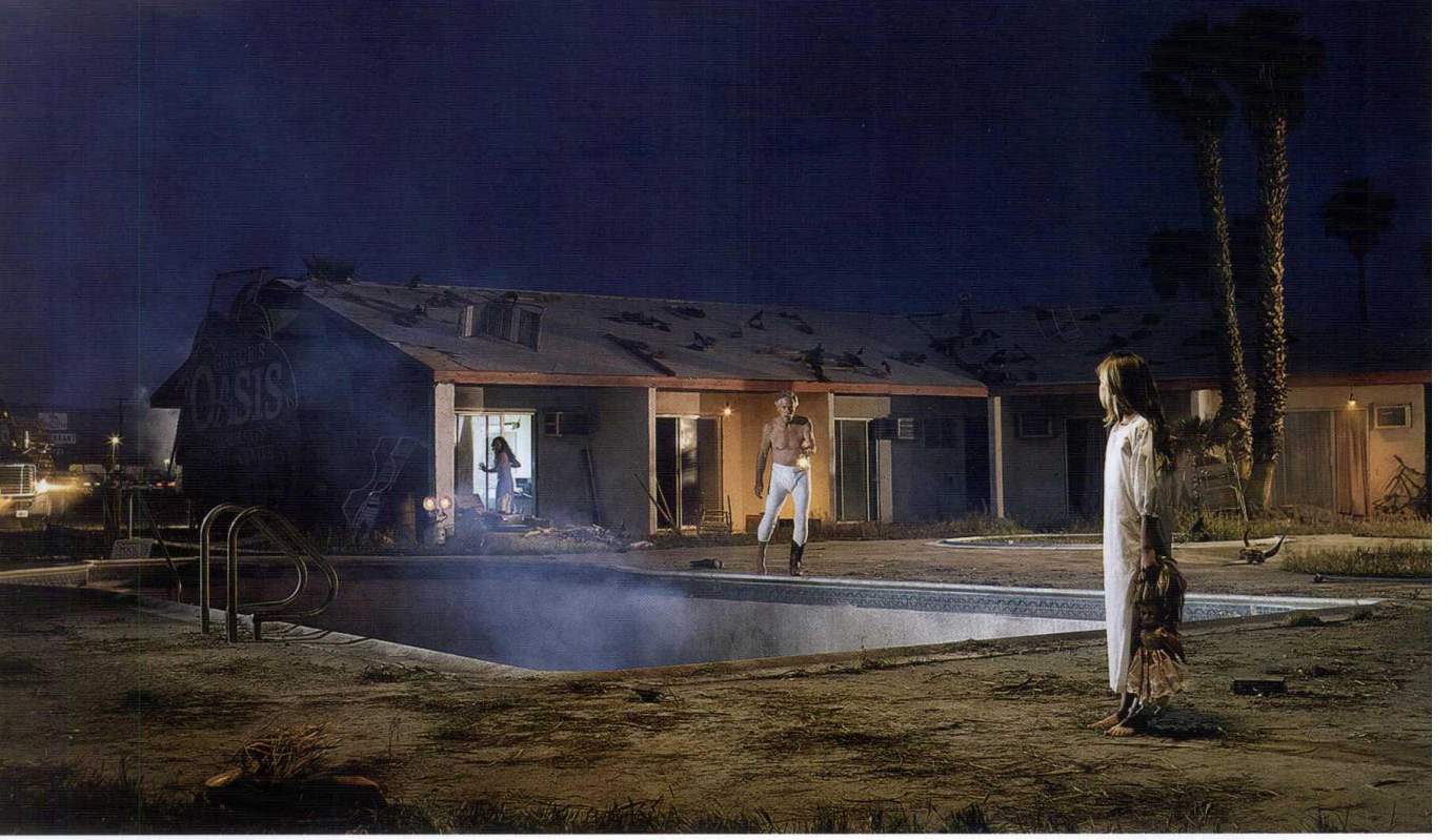
Ryan Schude'nin "At the Inn" adlı fotoğraf çalışması (Dan Busta işbirliğiyle), 2011.