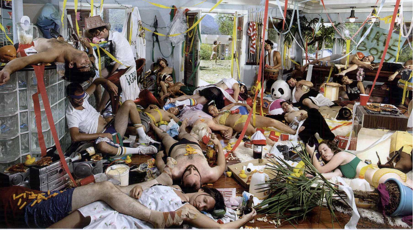
Ryan Schude'nin "After Party" (Parti Sonrası) adlı fotoğraf çalışması (Justin Bettman işbirliğiyle), 2010.